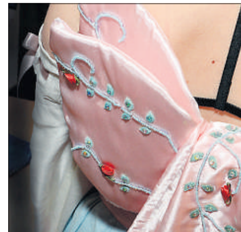
JAPANSK: Klærne til karakteren Yuna fra av japansk tradisjon.