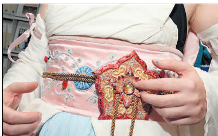
TIDKREVENDE: Anja har brukt mange timer på å få detaljene på kjolen perfekt.